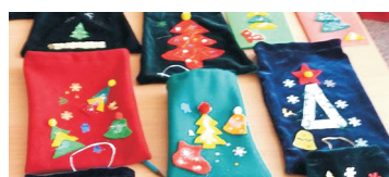
"Articole confecționate în atelierul de lucru al ASCHF-R Filiala Prahova"

◆ Femeile sunt mai afectate de lipsa materialelor igienico-sanitare decât bărbații, ceea ce poate conduce la discriminare multiplă.