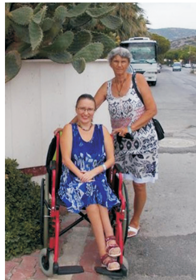
Acest interviu a fost realizat de Lavinia Besnea, Director executiv ASCHF-R Filiala Argeș

Știu că sună a lozincă, dar aș vrea să le transmit că "lumea lor este și lumea noastră" și așa cum luptă să ușureze traiul cetățenilor, așa trebuie să se gândească și la membrii mai puțin norocoși ai societății și să le creeze cadrul în care să-și poată desfășura viața, să-și fructifice talentele și să-și poată îndeplini visurile.